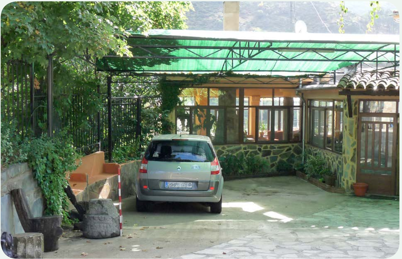
LOCALIZACIÓN ACTUAL (1). El fragmento de miliario en la entrada al complejo hostelero El Solitario, junto a la Nacional 630, en el término municipal de Baños de Montemayor (Cáceres).