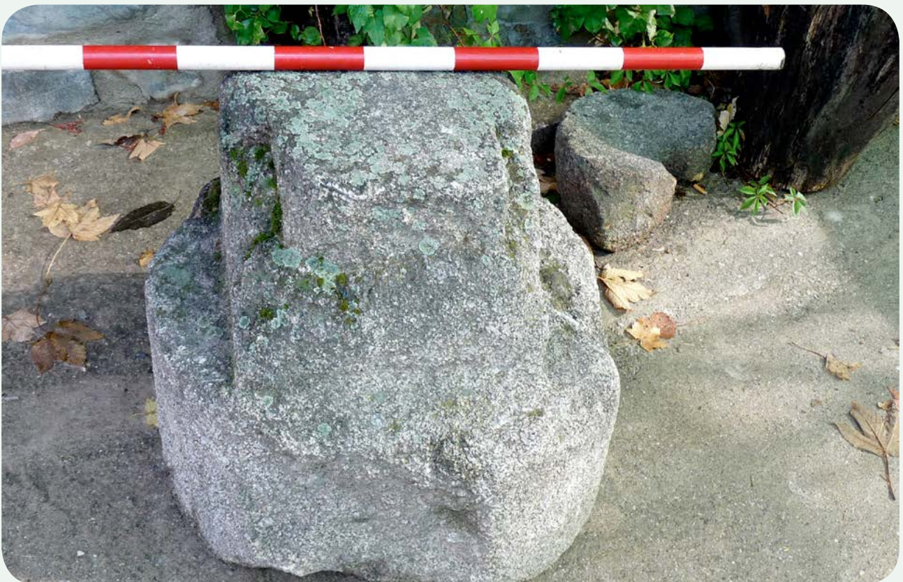
LOCALIZACIÓN ACTUAL (4). Vista de la parte trasera. El miliario sufrió un grave e irreparable daño como consecuencia de su adaptación seguramente para basa de columna, en un momento indeterminado.