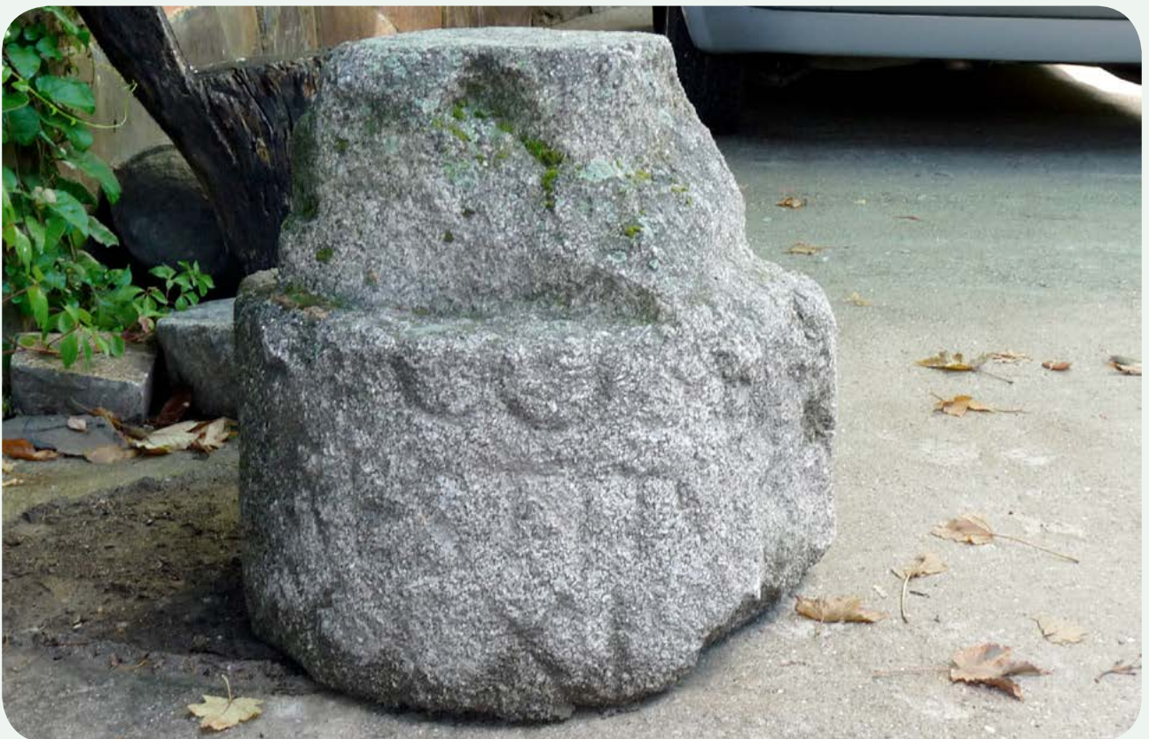
LOCALIZACIÓN ACTUAL (2). Vista del alterado soporte de este miliario, que señaló la milla 131 de la Vía de la Plata, según se aprecia en su numeral.