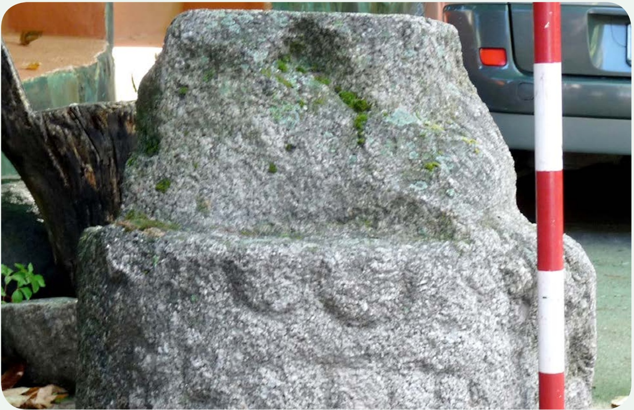
LOCALIZACIÓN ACTUAL (3). Detalle escalado del fragmento, con la epigrafía. Se aprecia claramente el numeral; CXXXI.