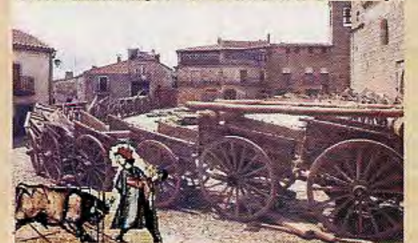
Aspecto de la Plaza durante los Encierros del Noveno.

En el mes de Agosto, se celebra un Mercado Medieval , promovido por las Asociaciones Culturales de San Felices de los Gallegos. Y también con sabor tradicional, el visitante puede adquirir en el Convento de la Pasión dulces y pastas , elaborados artesanalmente por la Comunidad de Monjas