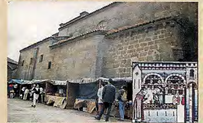
Mercado Medieval de San Felices.

La más célebre fiesta de la Villa, El Noveno , tiene su origen en una habitual imposición feudal. El cobro de la renta feudal por parte del Duque de Alba, correspondía a la novena parte de de la producción anual de cada habitante - de ahí su nombre - . Se intituyó en 1504, no sin la protesta de los " Hombres Buenos de la Villa ". Hasta tres siglos después no se aboliría tal práctica, según sentencia del 11 de Mayo de 1851.