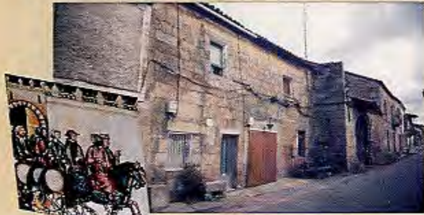
Ermita del Hospital de Roque Amador.

La arquitectura eclesiástica tiene en la Iglesia Parroquial su principal edificio. Podemos admirar su fachada oeste románica que ha sido fechada en el S.XIII. Sufrió importantes reformas en el S. XVI, que consolidaron su planta de salón y la cabecera gótica con una bella bóveda de crucería en estrella. El Convento agustino de la Pasión , conserva una hermosa fachada