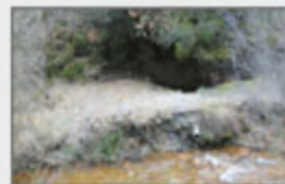
Fuente Ferrina La Silva