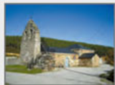
Iglesia de Santa Marina en Manzanal