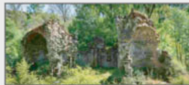
Monasterio de San Juan de Montealegre

Alrededor de las localidades de Montealegre, La Silva y Manzanal del Puerto se encuentran diversos atractivos turísticos recogidos dentro del recorrido "Oro, Carbón y Pan" que permiten disfrutar de lugares tranquilos y acogedores, cargados de naturaleza e historia humana.