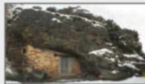
Eremita Peña de Santo Tirso en Manzanal