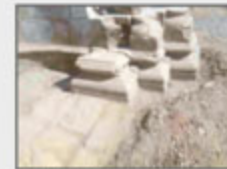
Canchales tallados en el Monasterio de San Juan de Montealegre