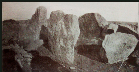
Fotografía que muestra el estado del dolmen en la década de 1930.

El abrigo del Casal del Gato es una fractura natural en un afloramiento granítico donde se abre un corto y angosto pasadizo cuyas paredes se hallan llenas de cazoletas , en su mayoría de entre 2 y 7 cm de diámetro. Los roquedos con este tipo de decoración —en ocasiones acompañada de representaciones humanas y animales, entre otros motivos, todo ello en un estilo esquemático— suelen estar asociados, en el centro y la oeste peninsular, con necrópolis megalíticas y poblados del Neolítico Final y de la Edad del Cobre o Calcolítico. Los grabados de este abrigo, como los de su entorno, probablemente se deben a comunidades implicadas en la construcción y uso del dolmen del Casal del Gato durante esos periodos o en la Edad del Bronce, momento este último al que remite algún hallazgo cerámico.