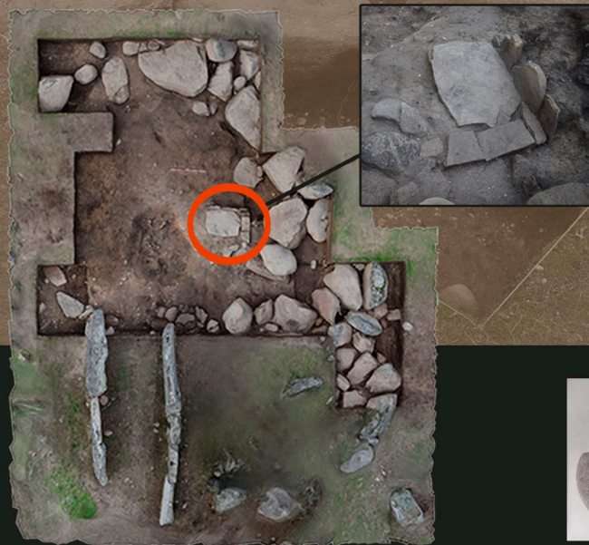
Fotogrametría de la planta final de la excavación del dolmen en 2018 y detalle de la tumba de cista .