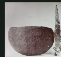
Imagen izq. Cerámica y hoja de puñal de cobre recuperadas por el padre Morán. Derecha. Industria lítica y cuentas de collar de variscita halladas durante las excavaciones arqueológicas de 2018.