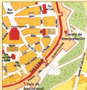
Situación del Centro de Interpretación en Ciudad Rodrigo

Fundación del Patrimonio Histórico de Castilla y León