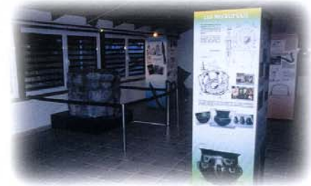
Piso superior del Aula Arqueológica con información sobre las costumbres funerarias de los vettones.

Las formas de vida de estas gentes prerromanas así como la historia y características principales de este gran yacimiento se encuentran explicadas de manera amena y didáctica en el Aula Arqueológica de la Mesa de Miranda, situada en la localidad de Chamartín, una atractiva instalación en la que puede entrarse en contacto con el poblado y sus habitantes través de paneles, maquetas, audiovisuales y fidedignas reproducciones de los enseres domésticos, utillaje y armamento de la época, así como juegos y elementos interactivos que invitan a la participación de todos los públicos.