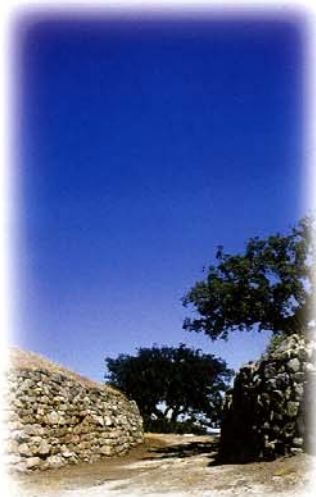
Una de las entradas al castro tras su consolidación.

El Castro de La Mesa de Miranda es un poblado fortificado perteneciente al pueblo de los vettones, gentes prerromanas del suroeste de la Meseta que entre los siglos VI y I a.C. desarrollaron una cultura de marcada personalidad arqueológica, entre cuyas evidencias destacan de manera especial sus asentamientos amurallados, la diestra metalurgia y las singulares manifestaciones escultóricas en piedra de cerdos y toros, los llamados "verracos".