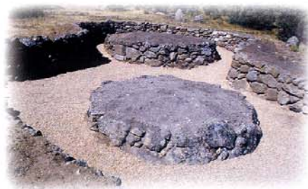
Túmulos funerarios de la necrópolis de La Osera

Muchas de las estructuras del castro correspondientes sobre todo a sus elementos defensivos y algunas construcciones funerarias fueron objeto de excavaciones arqueológicas hace más de cincuenta años, si bien, no ha sido hasta fechas recientes cuando se han llevado a cabo en el poblado importantes labores de consolidación, acondicionamiento para la visita, limpieza y señalización, financiadas por la Fundación del Patrimonio Histórico de Castilla y León, Diputación Provincial de Avila y la Administración Regional.