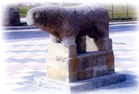
"Verraco" en la localidad de Chamartín.

El Castro de La Mesa de Miranda es un poblado fortificado perteneciente al pueblo de los vettones, gentes prerromanas del suroeste de la Meseta que entre los siglos VI y I a.C. desarrollaron una cultura de marcada personalidad arqueológica, entre cuyas evidencias destacan de manera especial sus asentamientos amurallados, la diestra metalurgia y las singulares manifestaciones escultóricas en piedra de cerdos y toros, los llamados "verracos".