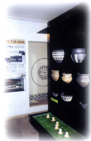
Aula arqueológica. Zona de reproducciones corínticas y técnicas decorativas

Las formas de vida de estas gentes prerromanas así como la historia y características principales de este gran yacimiento se encuentran explicadas de manera amena y didáctica en el Aula Arqueológica de la Mesa de Miranda, situada en la localidad de Chamartín, una atractiva instalación en la que puede entrarse en contacto con el poblado y sus habitantes través de paneles, maquetas, audiovisuales y fidedignas reproducciones de los enseres domésticos, utillaje y armamento de la época, así como juegos y elementos interactivos que invitan a la participación de todos los públicos.